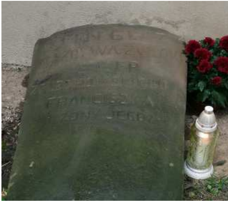
Nagrobek Franciszka Żelechowskiego przy kościele w Podstolicach