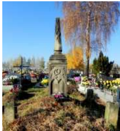
Grób Rodziny Żelechowskich na cmentarzu w Podstolicach