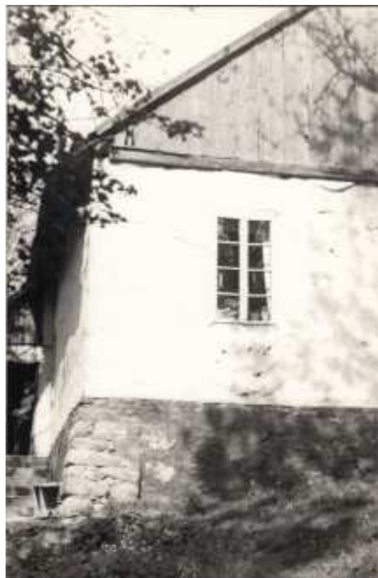
Fragment dworu w Rzeszotarach