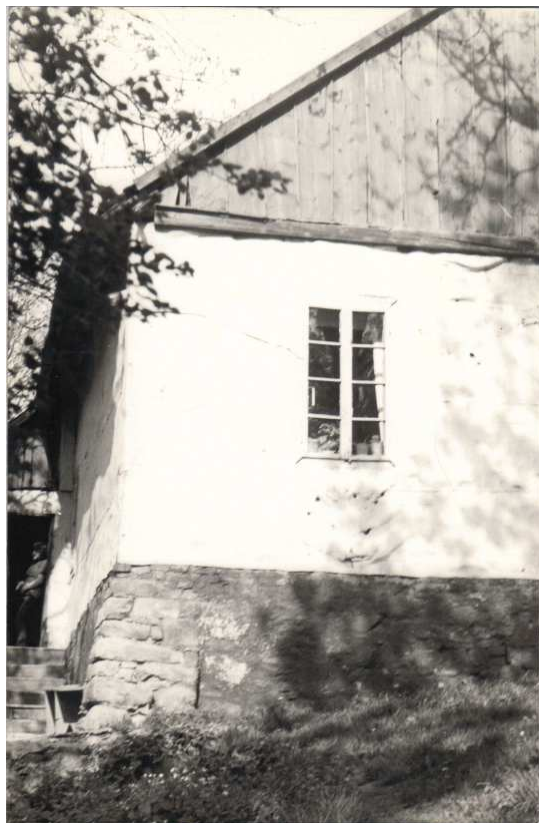
Fragment dworu w Rzeszotarach