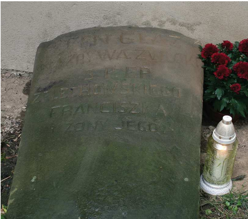
Nagrobek Franciszka Żelechowskiego przy kościele w Podstolicach