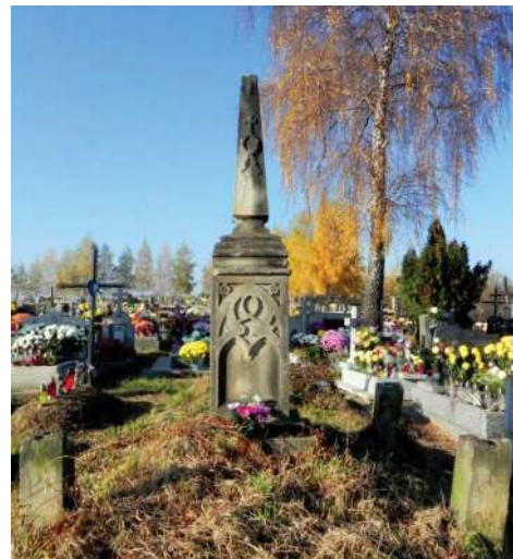
Grób Rodziny Żelechowskich na cmentarzu w Podstolicach